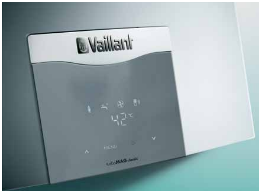
Upravljačka ploča turboMAG uređaja