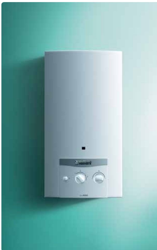
atmoMAG XZ mini